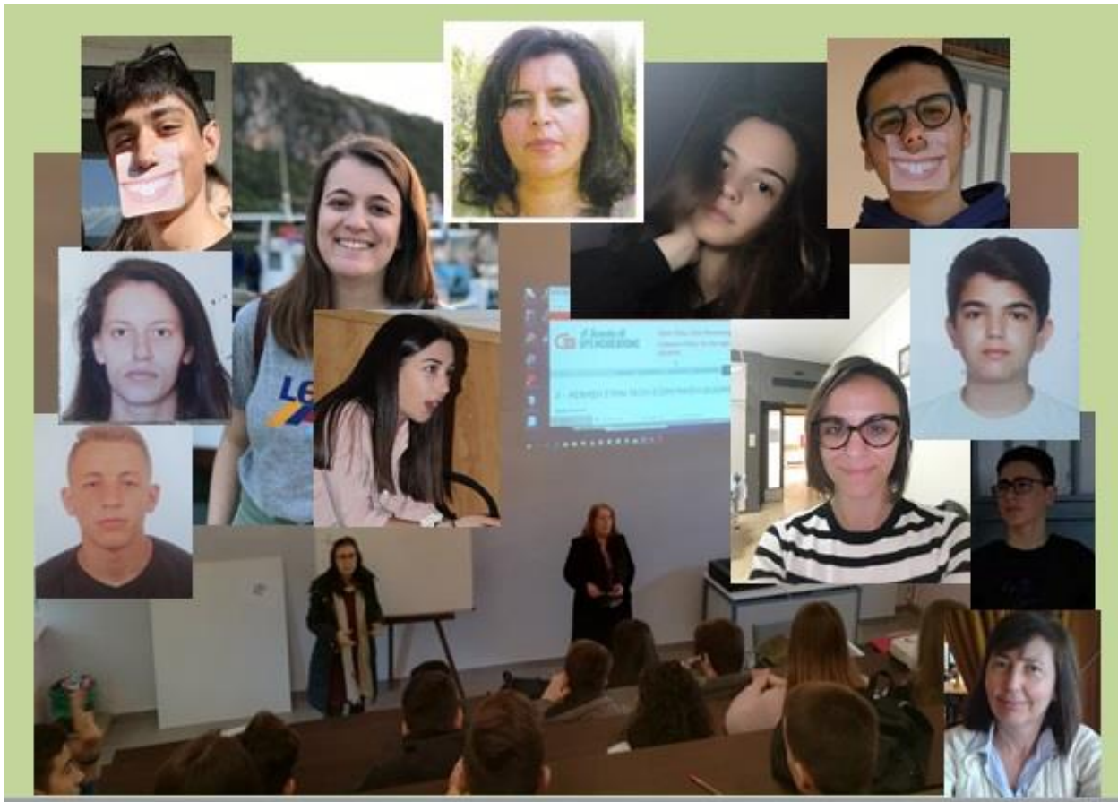
Εικόνα 1 * -Μέλη της ομάδας «1821 teenseyes» του 2 ου ΕΠΑΛ ΚΑΛΑΜΑΤΑΣ