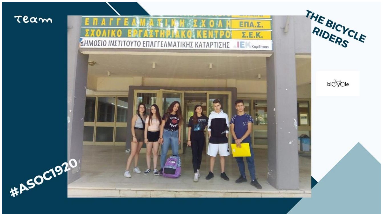
Εικόνα 1 *