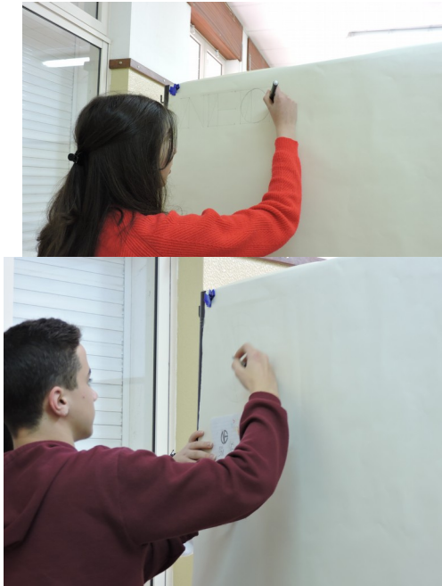
Imagem do blog post - 1* (formato JPG)

Partindo do conhecimento de que a nossa escola irá receber equipamentos novos, a pesquisa consistirá na aquisição e partilha de dados acerca dos bens adquiridos e da sua implementação. Pretendemos ainda sondar a comunidade escolar acerca da pertinência e utilidade dos materiais adquiridos e disponibilizados à escola.