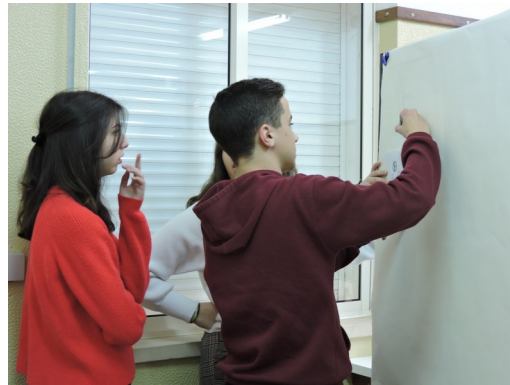
Imagem do blog post – 2* (formato JPG)