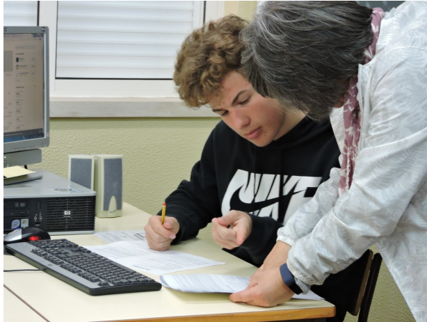
Imagem do blog post – 3* (formato JPG)