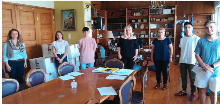
ΣΥΝΕΝΤΕΥΞΗ ΜΕ ΑΝΤΙΠΕΡΙΦΕΡΕΙΑΡΧΗ Κ. Δ. ΚΟΛΥΝΔΡΙΝΗ