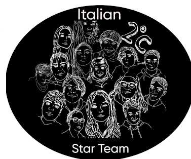
Logo di Bianca