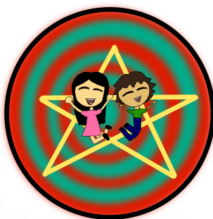
Logo di Francesca