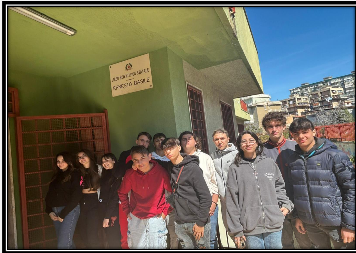
FOTO DEL GRUPPO